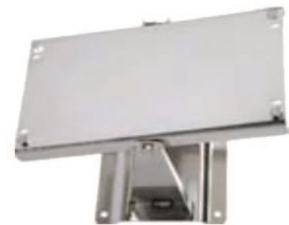
Passend zu: SRI.3425