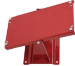
Optionales Zubehör: Art.Nr. SRK.9777