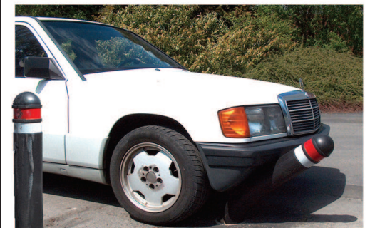
Poller nach Überfahren