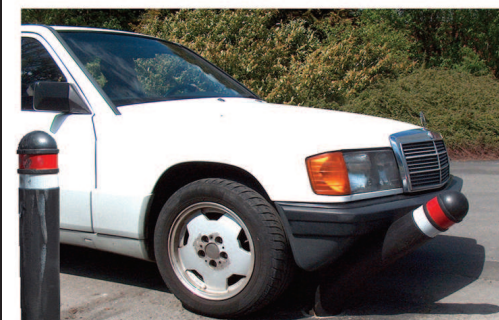
Poteaux de protection « écraser »